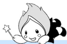
オリジナルキャラクター あかりちゃん