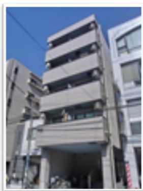
西川口2-2-8 青和ビル1F 八代耳鼻科さんの横